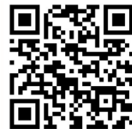
신청 및 접수 QR코드

* MyBusan 홈페이지 → 홈페이지 상단 [공지 및 커뮤니티] → [BGCF 외국인주민커넥터] → [커넥터 사업 소개] → [신청 및 접수] ( https://mybusan.kr/sub1/sub3_1.php )